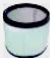
Filtro Poliestere lavabile