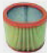
Filtro HEPA per polveri tossiche/fini