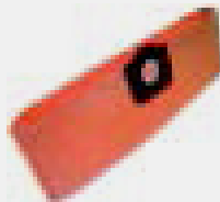
Filtro in carta