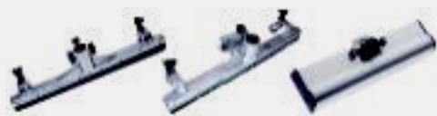
Accessori Fissi - POLVERE / LIQUIDI / WORTEX